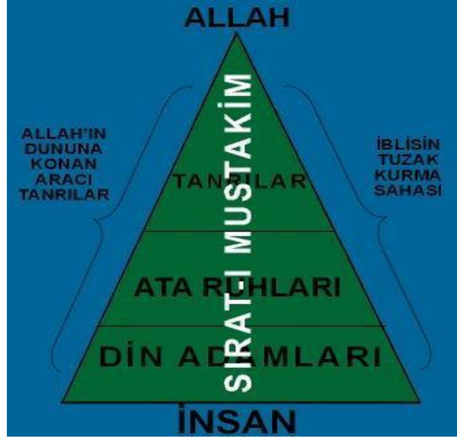
ŞİRKİN GENEL YAPISI

Şirkin yapısı aşağıdaki gibi gösterilebilir: