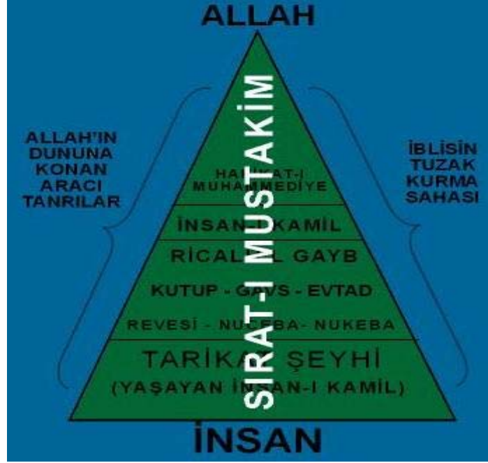
TARİKATLARDA GÖRDÜĞÜMÜZ ARACILAR

Hristiyanlıkta aracılık inancı olduğu genişçe anlatılmıştı. Ona benzer bir inancın bir kısım tarikatlarda da olduğunu göstermeye çalışacağız. Aslında incelediğimiz tarikatların tamamında aracılık inancının var olduğunu gördük. Tarikatların hepsini incelemediğimiz için ihtiyatlı bir dil kullanmayı uygun bulduk. Tarikatlardaki araçlar, Hristiyanlarda ve Taoistlerde olana benzer bir yapı oluşturmaktadır. Bu yapı, yaklaşık olarak şöyledir: